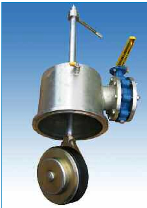
ART.504 TAMPONATRICE - PLUGGING 8" ART.505 TAMPONATRICE - PLUGGING 10" ART.506 TAMPONATRICE - PLUGGING 12"