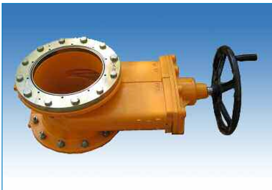
ART.501 VALVOLA A CUNEO GOMMATO - RUBBER WEDGE 8" ART.502 VALVOLA A CUNEO GOMMATO - RUBBER WEDGE 10" ART.503 VALVOLA A CUNEO GOMMATO - RUBBER WEDGE 12"